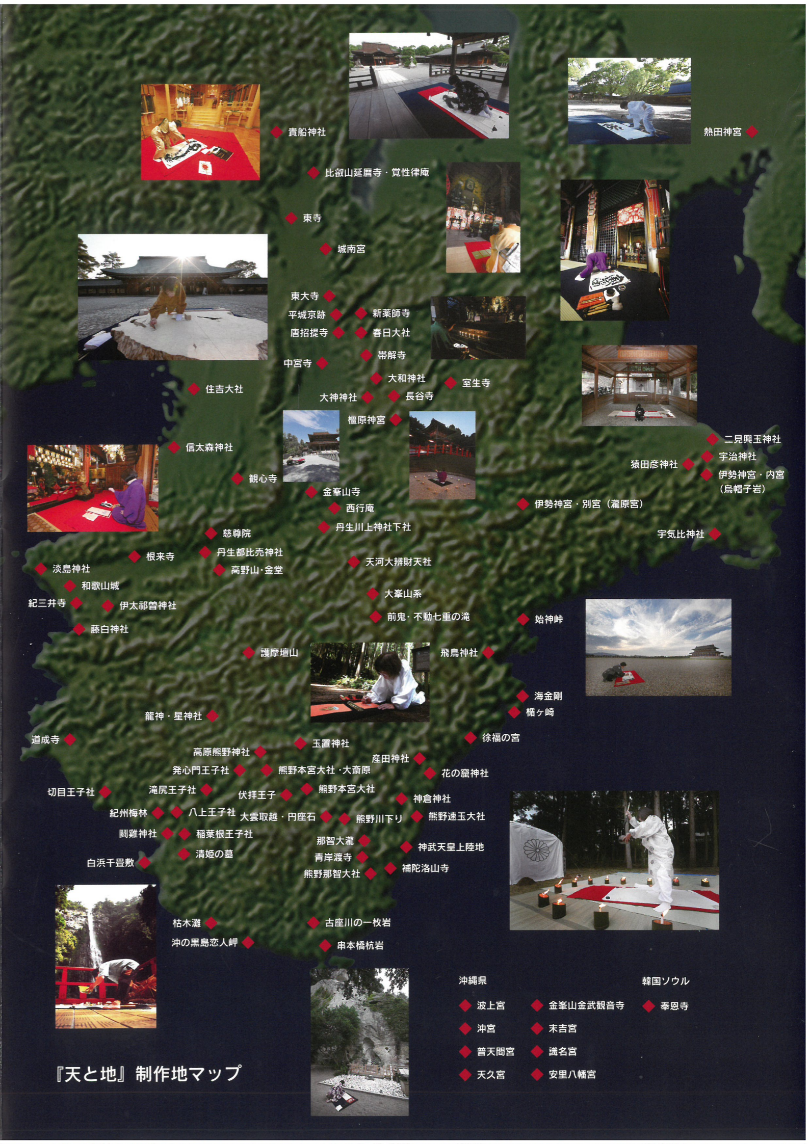
『天と地』制作地マップ